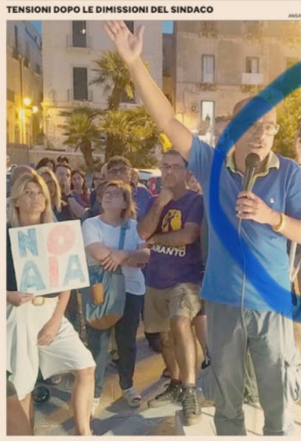
Le proteste. Movimenti ambientalisti contestano il piano per l'ex Ilva a Taranto

Spread ai minimi dal 2010. Borse in ottima salute ed euro in flessione sul dollaro che dà fiato alle imprese europee. Due giorni dopo il discusso accordo sui dazi raggiunto fra Europa e Stati Uniti il mercato cerca di voltare pagina dopo un prolungato periodo di incertezza legato alle tensioni commerciali. Intanto il Fondo monetario internazionale alza le stime di crescita globali: rispetto ad aprile, il Pil del 2025 viene rivisto al rialzo al 3% e nel 2026 al 3,1%, grazie agli scambi intensificati per anticipare i dazi. Migliora anche l'Italia: Pil +0,5%. Cellino e Valsania — a pag. 2