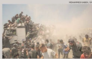
Assalto agli aiuti. Palestinesi a Gaza salgono sui camion che trasportano viveri

LA CARNEFICINA: IERI ALMENO 113 PALESTINESI UCCISI Rapporto dell'Ipc (Onu): «Gaza verso lo scenario peggiore: la carestia» Roberto Bongiorno — a pag. 11